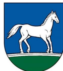
Obrázok 2 Erb obce

Erb obce Bajany tvorí v modrom štíte na zelenej oblej strieborným deleným pruhom lemovanej pažiti stojaci strieborný obrátený kôň.