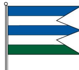
Obrázok 3 Vlajka obce

Vlajka obce Bajany pozostáva z piatich pozdĺžnych pruhov vo farbách 1/5 modrá, 1/5 biela, 1/5 modrá, 1/5 biela, 1/5 zelená. Vlajka má pomer strán 2:3 a ukončená je troma cípmi, t.j. dvoma zástrihmi, siahajúcimi do tretiny jej listu.