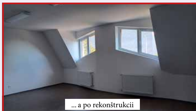
... a po rekonštrukcii