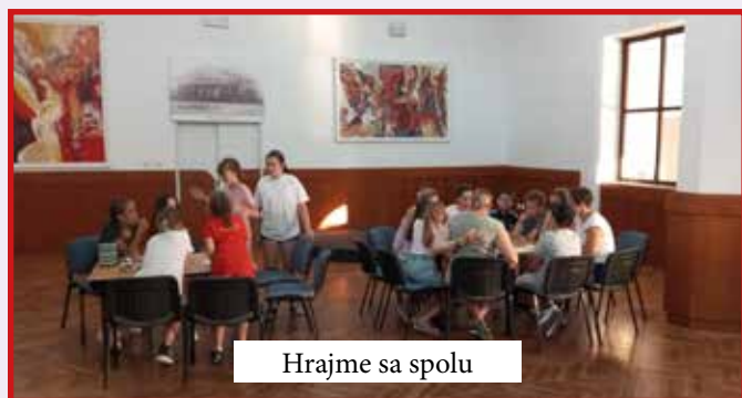
Hrajme sa spolu