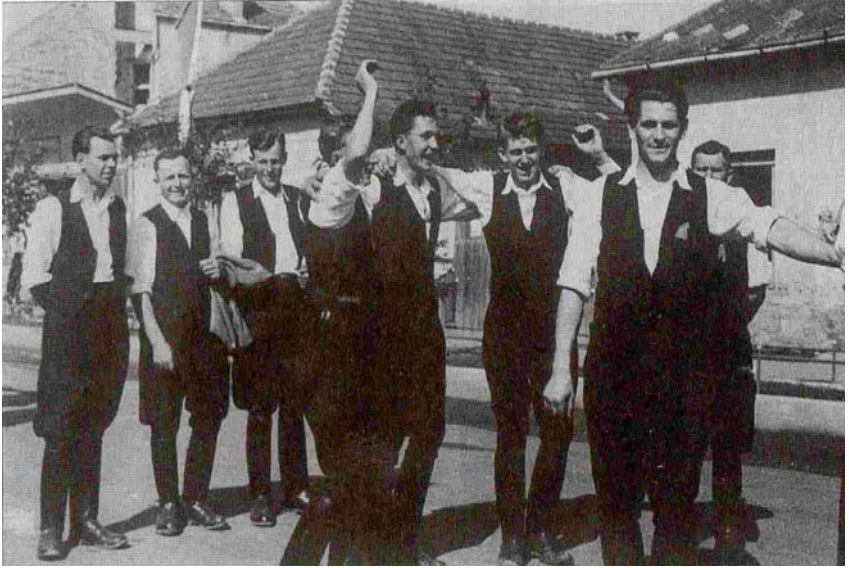
Mulató ifjúság 1960 körül