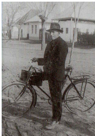
Az első bicikli a Derékon