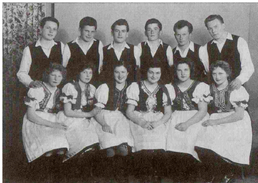
A nagyéri táncsoport 1956-ban, ami a mai napig is sikeresen működik