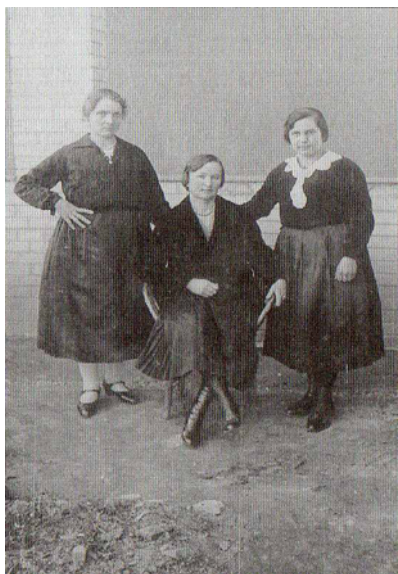
Lányok nagykéri népviseletben, 1930