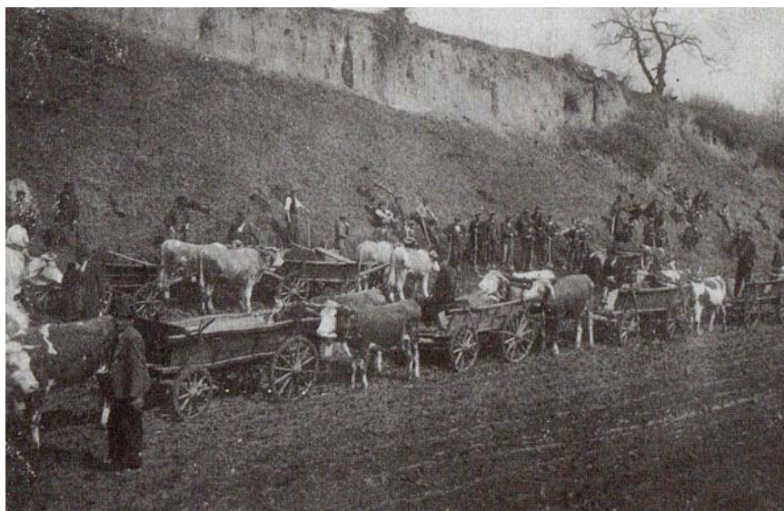
Közös munka Cserdaútban, 1935