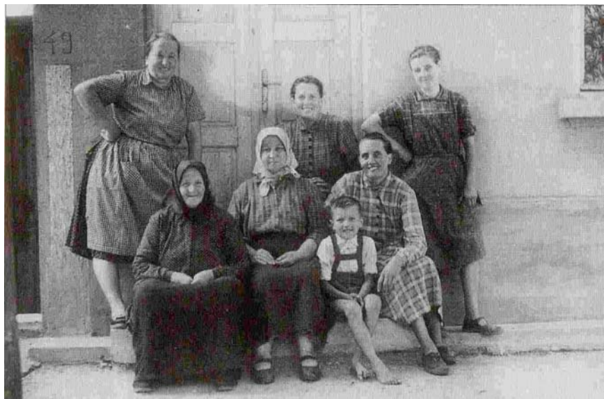
Utcai terefere 1958-ban