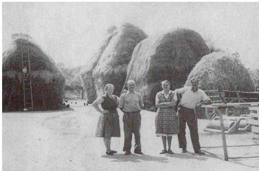
Gazdasági udvar cséplés előtt, 1950