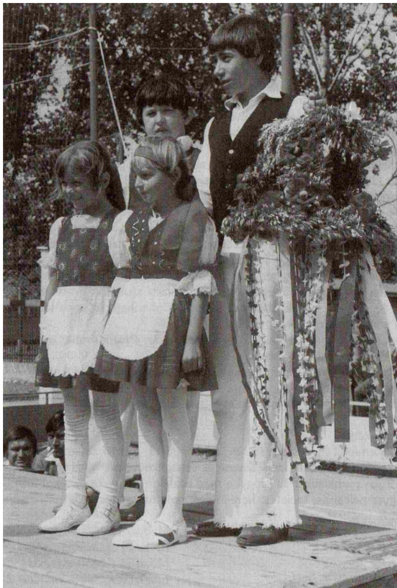
Nagykéri gyerekek az aratókoszorúval, 1981