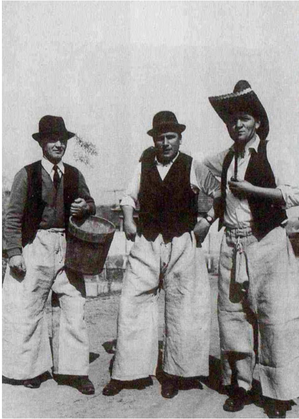
Vásongatyások húsvétkor, 1962