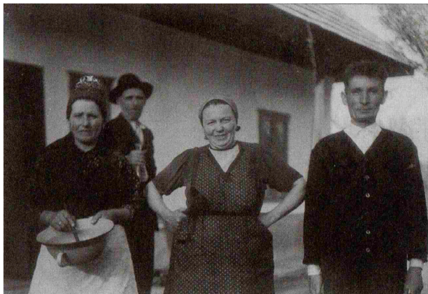
Házimunkák közben 1954-ben