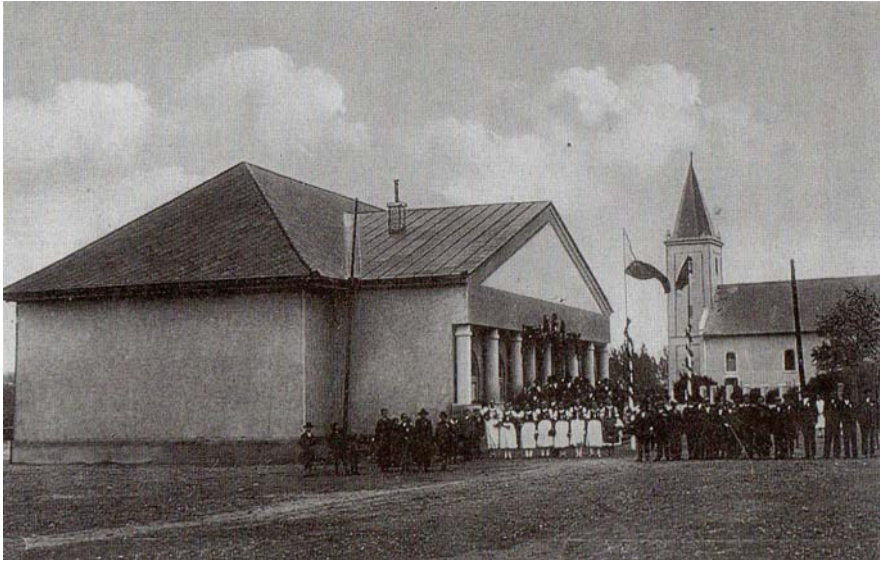
A kultúrház átadásán 1937-ben