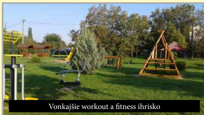
Vonkajšie workout a fitness ihrisko