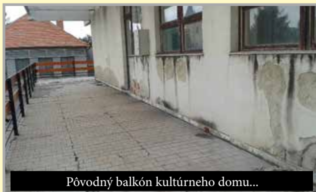
Pôvodný balkón kultúrneho domu...

sa zrealizovalo ozvučenie zasadacej miestnosti; zmodernizovali sa zastaralé priestory obradnej siene, chodby a vnútorného schodiska. Po 19 rokoch užívania prístavby obecného úradu sme zabezpečili jej kolaudáciu a zapísanie do majetku obce.