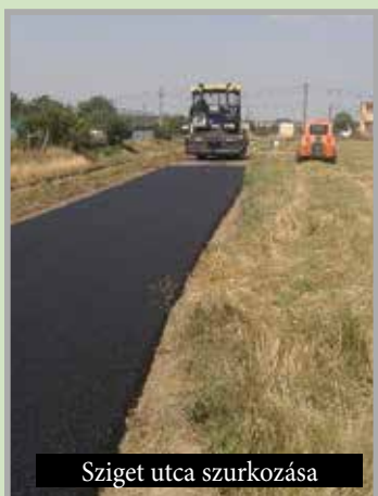
Sziget utca szurkozása