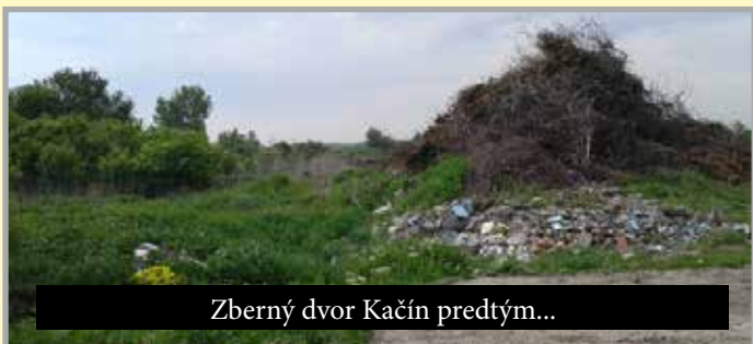
Zberný dvor Kačín predtým...

vacie miesta pre návštevníkov a kvôli lepšej orientácii cudzích návštevníkov boli na oboch cintorínoch osadené informačné tabule hrobových miest. Počas volebného obdobia sa vo veľkom kultúrnom dome postupne vykonali rôzne úpravy: vymaľovalo sa schodisko vedúce do obecnej knižnice a uložila sa tu nová dlažba namiesto poškodeného linolea; vymaľoval sa vestibul a klub dôchodcov, ktoré dostali aj nové záclony; na vonkajšie schody sa uložila protišmyková dlažba a vybudoval sa bezbariérový prístup do budovy. Nová dlažba sa uložila aj na schodisko za pódium