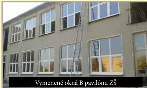
Vymenené okná B pavilónu ZŠ