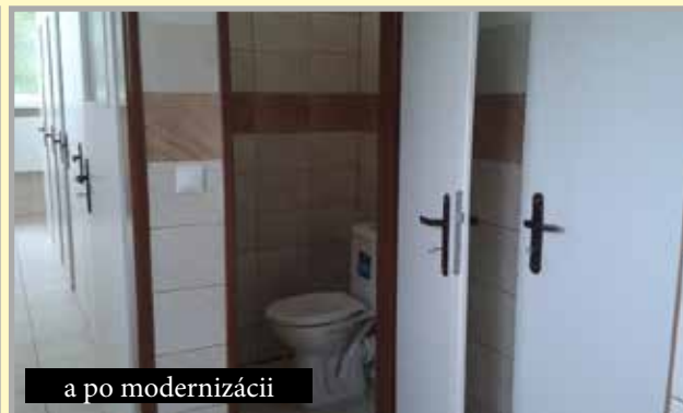
a po modernizácii

nia a stavebného povolenia, čiže na budúci rok sa aj tento investičný zámer bude môcť realizovať. Pomocou dotácie na prevenciu kriminality sme vybudovali kamerový systém obce, ďalšie kamery nám dala súkromná firma. Starostlivosť o mladé rodiny