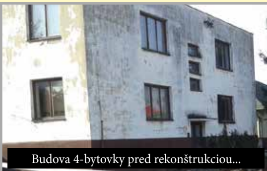
Budova 4-bytovky pred rekonštrukciou...