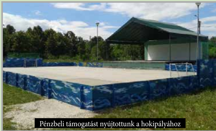
Pénzbeli támogatást nyújtottunk a hokipályához