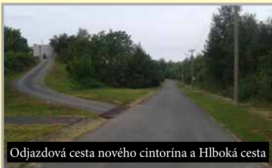
Odjazdová cesta nového cintorína a Hlboká cesta