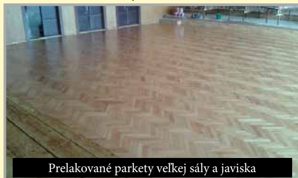
Prelakované parkety veľkej sály a javiska

nám bola Ministerstvom ŽP SR schválená dotácia na zníženie energetických nárokov 50-ročnej jedálne základnej školy s MŠ - rekonštrukčné práce sa začnú po ukončení