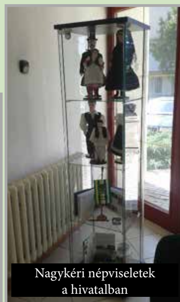
Nagykéri népviseletek a hivatalban

A 2016-os évben felújítottuk a ravatalozó belső tereit, le-