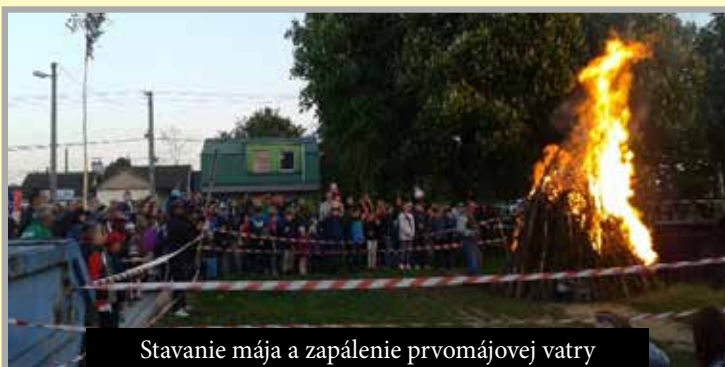
Stavanie mája a zapálenie prvomájovej vatri