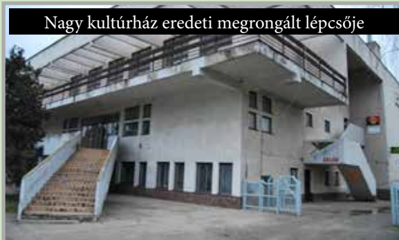
Nagy kultúrház eredeti megrongált lépcsője