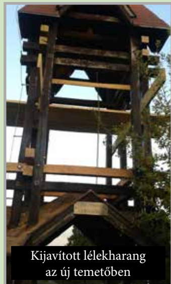
Kijavított lélekharang az új temetőben