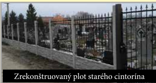
Zrekonštruovaný plot starého cintorína