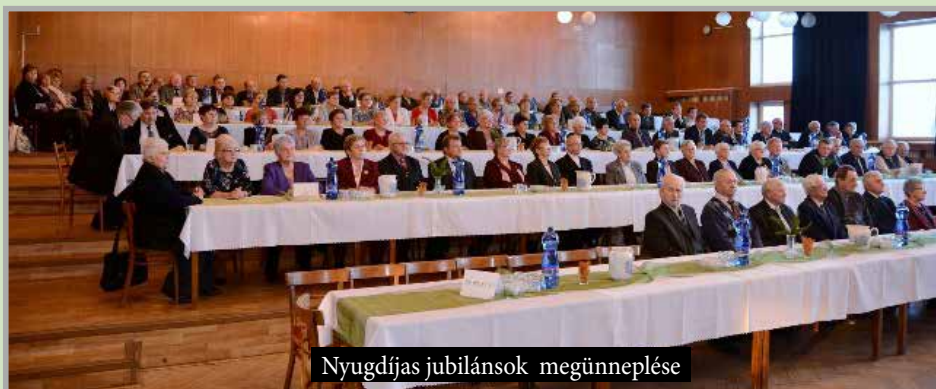
Nyugdíjas jubilánsok megünneplése

menti része), leburkoltattuk az új temetőbe vezető utat és a temető lejáróját és 2018-ban felújítottuk a Cserda út 2200 m 2 -ét. Az I/64-es főút melletti biztonságosabb közlekedés érdekében a 2018-as évben új kijelölt gyalogos átjárót létesítettünk. A tervezett Ujvári utcai járda kijaítása a különböző nehézségek ellenére már engedélyzve.