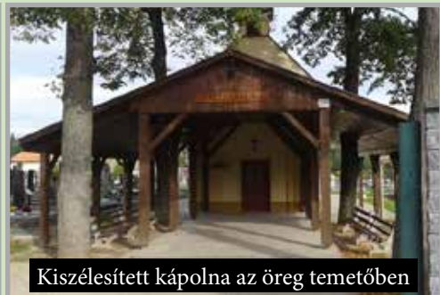
Kiszélesített kápolna az öreg temetőben