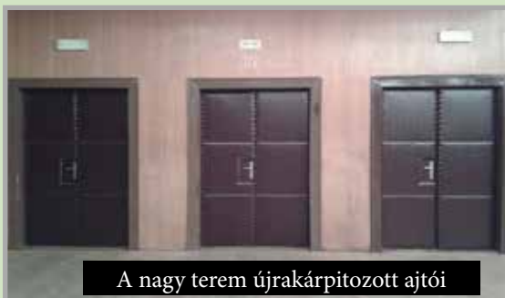
A nagy terem újrakárpitozott ajtóit