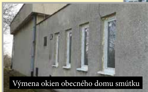
Výmena okien obecného domu smútku