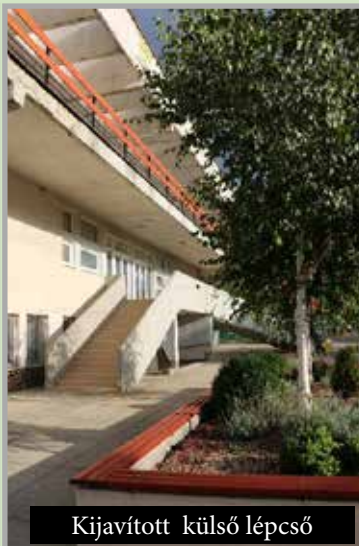
Kijavított külső lépcső