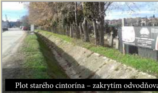
Plot starého cintorína – zakrytím odvodňovacieho kanála sme získali parkovacie miesta