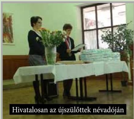
Hivatalosan az újszülöttek névadóján