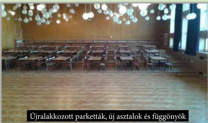
Újralakozott parketták, új asztalok és függönyök