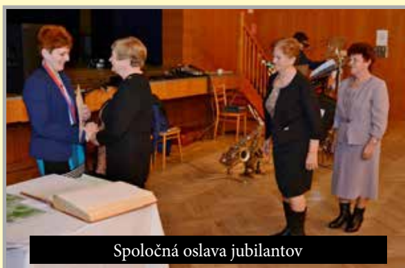
Spoločná oslava jubilantov

zabíjačkových špecialít pre občanov obce a spoločná oslava okrúhlych životných jubileí seniorov obce (65, 70, 75, 80, 85-ročných a viac) so zábavným programom. Obecný deň organizujeme každoročne ku dňu sv. Anny,