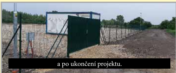
a po ukončení projektu.