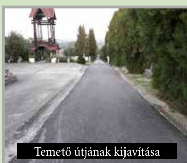
Temető útjának kijavítása

a foci pálya területének regenerálását és az öntözőrendszer