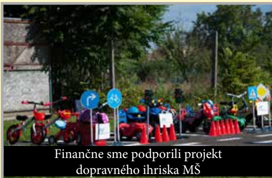
Finančne sme podporili projekt dopravného ihriska MŠ