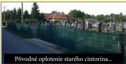
Pôvodné oplotenie starého cintorína...