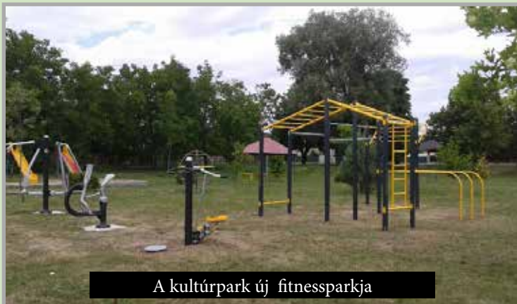
A kultúrpark új fitnessparkja