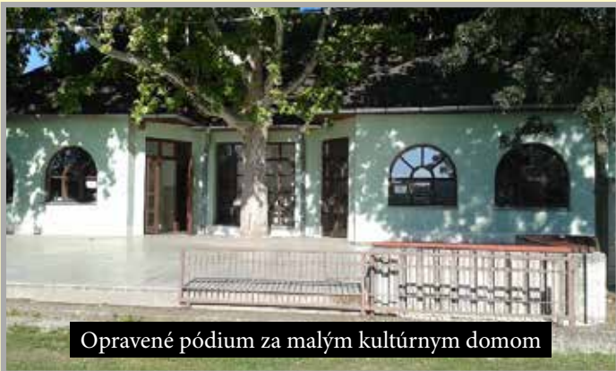
Opravené pódium za malým kultúrnym domom