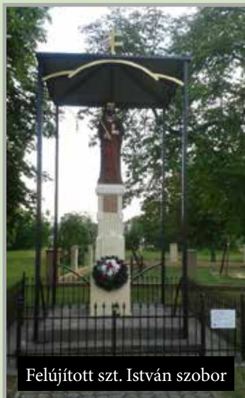
Felújított szt. István szobor