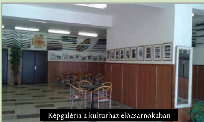
Képgaléria a kultúrház előcsarnokában