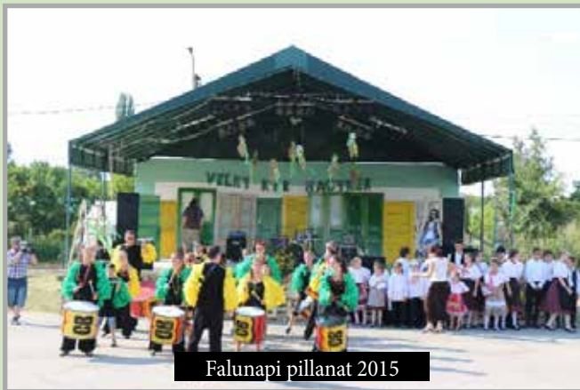
Falunapi pillanat 2015