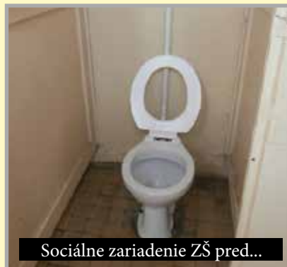
Sociálne zariadenie ZŠ pred...