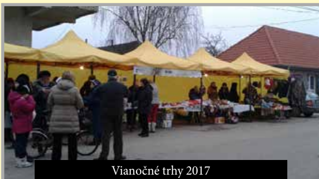
Vianočné trhy 2017

futbalového klubu bol starosta obce, avšak po komunálnych voľbách som ako novozvolená starostka túto funkciu neprijala . Niektorí neprajníci vešteli koniec kýrskeho futbalu, vinu