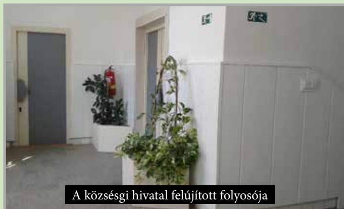
A községi hivatal felújított folyosója

séget és szociális helységet is. A kultúrház nagytermének mindhárom megrongált bejáratit ajtaját újrakárpitoztattuk, újralakoztuk a nagyterem parkettjét és a pódiumot; kicseréltük a nagyterem szakadozott sötétítő függönyeit és lecseréltük a nagyterem és nyugdíjasklub 37 leamortizált