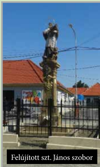
Felújított szt. János szobor

tásra is szorulnak. A 2017-es évben a Cedron Nitrava Helyi akciócsoport által nyert pá-