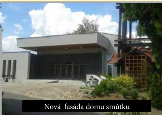
Nová fasáda domu smútku