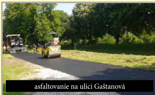
asfaltovanie na ulici Gaštanová