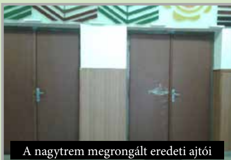
A nagyterem megrongált eredeti ajtóit