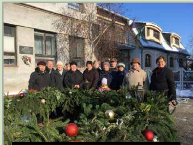
Közösen készítettük és díszítettük fel az adventi koszorút is

Sok aktív szervezetünk saját rendezvényt szervez vagy aktivitásával hozzájárul a falunap programjához. Néhány szervezet közös projekt szervezésével is igyekszik dotációt szerezni tervezett programjaik