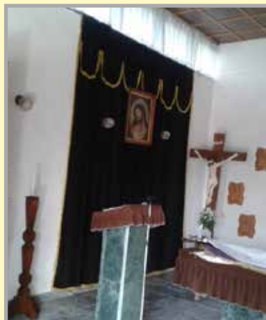
Vnútročné priestory domu smútku pred rekonštrukciou

V areáli kultúrneho parku sme vybudovali novú prístupovú cestu; priestory sme skultúrili osadením dvoch prístreškov so sedením a zriadili sme tu aj fitness park a workout ihrisko. Pre najmenších sme v priebehu tohto