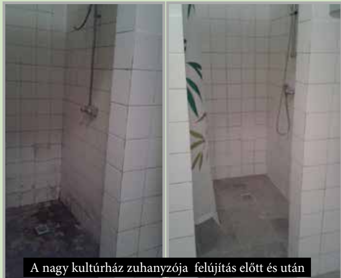
A nagy kultúrház zuhanyzója felújítás előtt és után