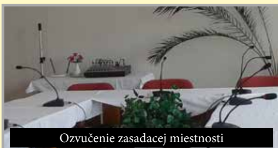
Ozvučenie zasadacej miestnosti

vybudovaním prístavby k jestvujúcej MŠ, čím by sme dokázali tento problém vyriešiť. Financovanie tejto investície plánujeme riešiť prostred-