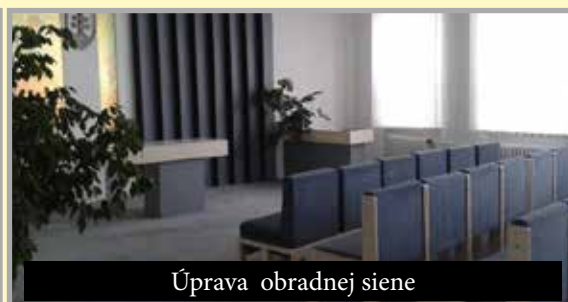
Úprava obradnej siene