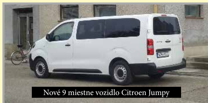
Nové 9 miestne vozidlo Citroen Jumpy

odpadu a ostatných zložiek triedeného odpadu. Za účelom skvalitnenia separovaného zberu sme do domácností zakúpili žlté zberné nádoby na zber plastového odpadu. Z dotácie Environmentálneho