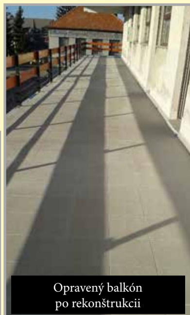
Opravený balkón po rekonštrukcii