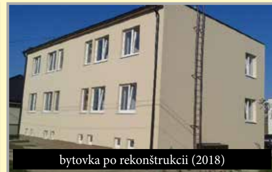
bytovka po rekonštrukcii (2018)

nie je ľahostajné ich okolie a poriadok v obci , z času na čas organizujú pre svojich členov a sympatizantov aj brigády na skrášľovanie vybraných častí obce. Atmosféra na týchto akciách je veľmi dobrá, výsledok šikovných rúk je viditeľný a dobrovoľné brigády majú aj výchovný charakter. Škoda len, že väčšina ľahostajných občanov sa nad týmito aktivitami iba pousmeje.