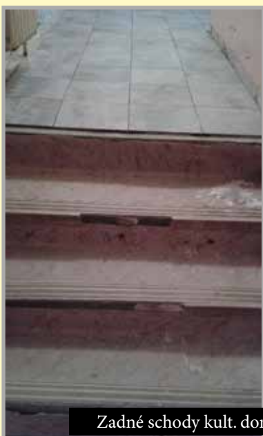
Zadné schody kult. domu pred a po rekonštrukcii