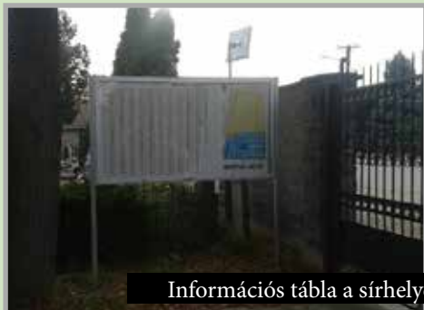
Információs tábla a sírhelyekről mindkét temető területén