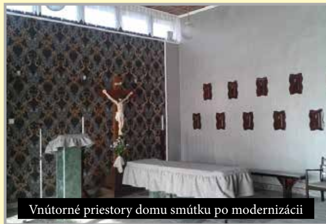
Vnútročné priestory domu smútku po modernizácii