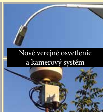
Nové verejné osvetlenie a kamerový systém

roka rozšírili toto obľúbené ihrisko o nové lezecké prvky z agátového dreva.