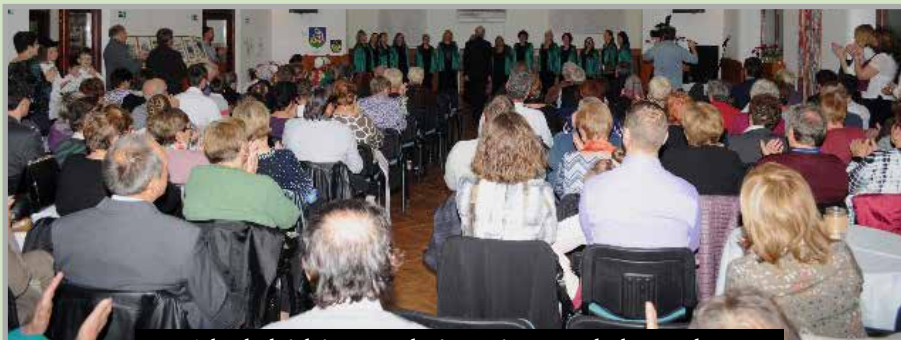
A kis kultúrház 80. születésnapját ünnepeltük 2017-ben

Hosszú évekig falunkban az volt a szokás, hogy a falu polgármestere volt a futballklub elnöke is egy személyben. Mint újdonsült polgármester, ezt a funkciót elutasítottam, így sokan a nagykéri futball végét jósolták, a futballklub belső problémáit megpróbálták másra hárítani. A kezdeti nehézségek elhárítása után a futballklub fenntartásának érdekében új szabályokat állítottunk fel és az új vezetőség mindent elkövetett, hogy a nagykéri foci újra a topon legyen. Csapatunk minden kategóriában jól szerepelnek, a sportklubnak hosszú idő után újra szponzorai vannak, akik anyagilag is hozzájárulnak a klub támogatásához és a vasárnapi meccseket rekord mennyiségű szurkoló látogatja. A helyi sakkozók klubja is magas szinten képviseli falunkat és a község támogatásban részesíti a hokejbal iránt érdeklődő fiatal játékosokat is. Annak érdekében, hogy minél több fiatal és gyereket kicsalogassunk a természetbe, tavaly