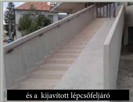
és a kijavított lépcsőfeljáró

lyázatból sikerült lefednünk és felújítanunk a templom melletti Szt. István szobrot, majd 2018-ban saját költségvetésből újítottunk fel a főtéren található Nepomuki Szt. János szobrát. Falunk főterén elhelyeztünk egy információs táblát is, amelyet a Nyitrai Megyei Hivatal támogatásából fedeztünk a hivatalos községi hirdetőtáblát pedig törvény szerint áthelyeztük a községi hivatal épülete mellé.