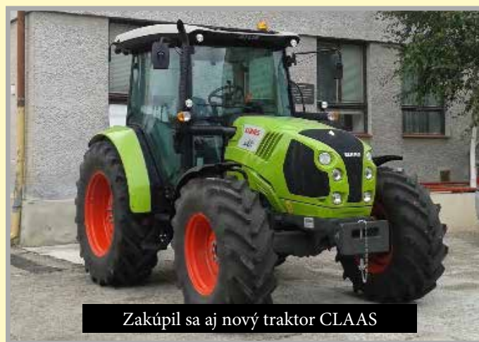
Zakúpil sa aj nový traktor CLAAS