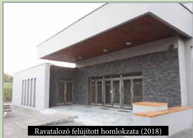
Ravatalozó felújított homlokzata (2018)

részére 2 db pihenőalkalmatosságot alakítottunk ki a játszótér területén, valamint új fitness – és workout parkot létesítettünk itt, amelyet kisgyermek számára fából készült mászóakkal egészítettünk ki ez év folyamán.