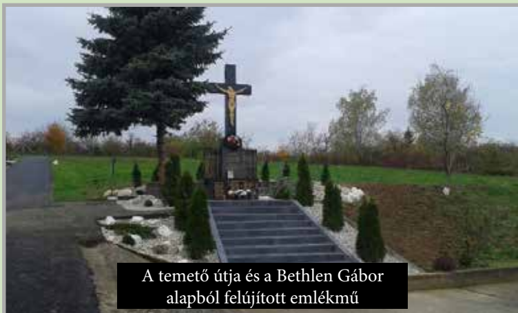
A temető útja és a Bethlen Gábor alából felújított emlékmű