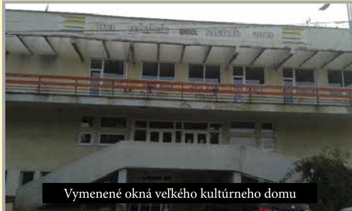
Vymenené okná veľkého kultúrneho domu

administratívnych formalít zmluvy o NFP ešte koncom tohto roka.