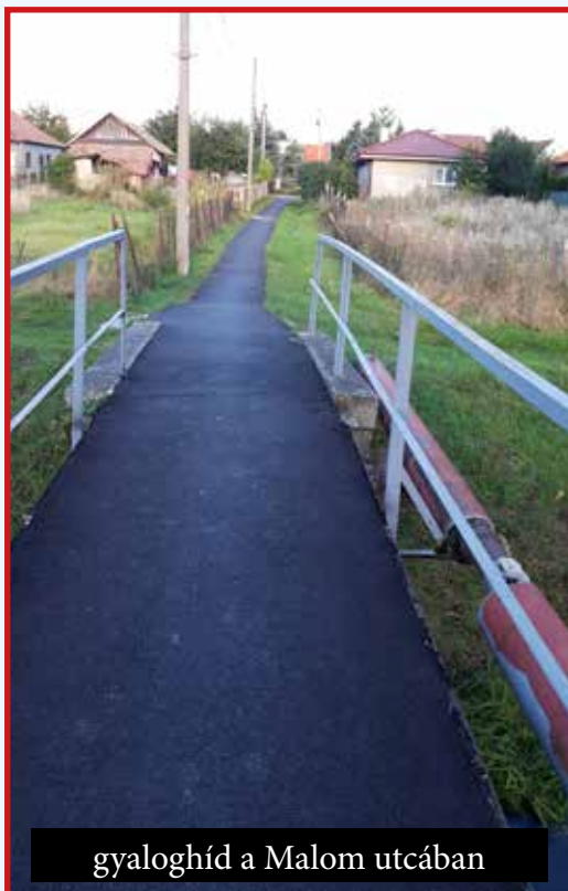
gyaloghíd a Malom utcában

Az I. hullám alatt kihirdetett válsághelyzetben a kiscétényi AB-STAV vállalat segítségével rekordidőben, 3 hónap alatt hajtottuk végre a köz-