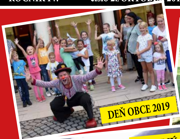
DEŇ OBCE 2019