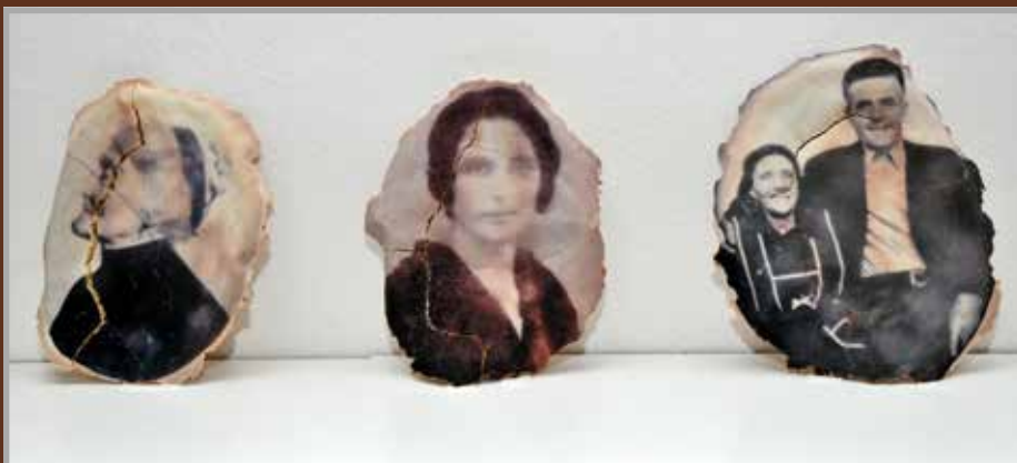
Nájdené telá – detail, inštalácia z chlebov, autorská technika, 2016

Na povrchu hrboľatých bochníkov z múky, vody a droždia sú tváre cudzích ľudí, ktoré som nachádzala v cintorínoch z najrôznejších kútov Európy, počnúc od Islandu až po Gruzínsko, od Španielska až po Macedónsko. Postupne tieto bochníky popraskajú a stávajú sa z nich iba omrvinky času podobne ako aj z nás.