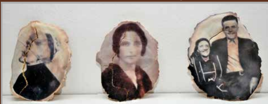
Talált testek - kenyér installáció, saját technika, 2016

A kenyértettek felületére simuló fotók egytől-egyig talált tárgyak ill. képek – különböző temetői sírkövekről becserkészett arcokról, egy Európa-szerte folytatott gyűjtögetés-barangolás darabjairól van szó (a portrék közt izlandi, macedóniai, spanyolországi, grúziai, bosnyák stb. temetőkből talált arcok sorakoznak). Mindezen túl pedig mintha egy finom, szomorú szimbolikájú ellenállási kísérlet (az idővel, az idő logikájának morzsoló erejével való dacolás) tárggyá tett reliktumai lennének.