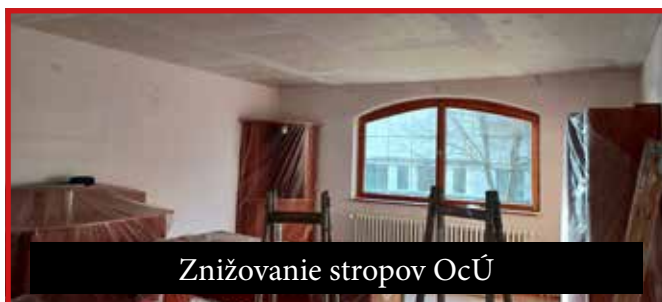
Znižovanie stropov OcÚ

da svojimi nesprávnymi rozhodnutiami neustále sťažuje fungovanie samospráv; mestá a obce využíva ako bankomaty na financovanie svojich sľubov (napr. vyplácanie daňových bonusov zo skráteného výnosu podielových daní obcí, alebo nútenie financovania výdavkov neštátnych sociálnych zariadení z rozpočtu samospráv, atď.). Napriek týmto problémom sa snažíme plány obecného zastupiteľstva našej obce postupne realizovať: od začiatku roka sme ukončili odstránenie chorobou napadnutých tují na ulici Hlavná; pri dome smútku sme uložili plánovanú zámkovú dlažbu; z dôvodu zníženia nákladov na energie sme znížili a zateplili stropy v prístavbe obecného úradu a vymenili sme tu aj svietidlá za úsporné. Z rovnakého dôvodu sa vymenili aj staré svietidlá prístupovej cesty nového cintorína za LEDkové. Poďakovanie patrí zamestnancom obce a podnikateľským subjektom,