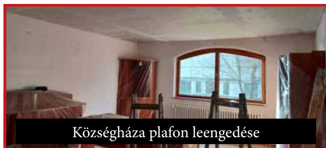
Községháza plafon leengedése

Ennek ellenére a képviselőtestületünk által támogatott terveinket fokozatosan teljesítjük: az év eleje óta befejeztük a Fő utcai beteg tujafák kivágását; a ravatalozó térkövének lerakását; energiacsökkenés miatt elvégeztük a községi hivatal új épületében a mennyezetek hőszigetelését és lámpacseréjét, valamint ugyanebből az okból energiatakarékos lámpákra cseréltük az új temető feljáróján a régi villanyokat is. Köszönet a község alkalmazottjainak és a megbízott vállalkozóknak, hogy az említett munkákat