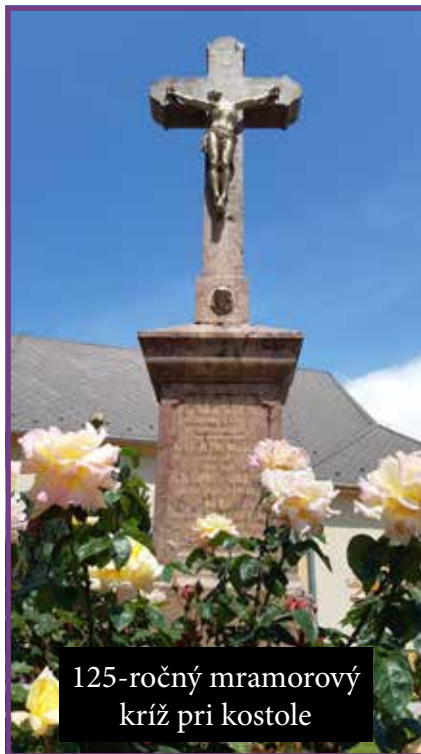
125-ročný mramorový kríž pri kostole