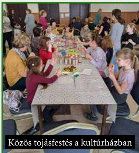
Közös tojásfestés a kultúrházban

csolása, hanem a szürke hétköznapokból való kiszakadásra is lehetőséget nyújtanak. Legutóbbi lehetőség a közös találkozásra, közösségünk javára április 21-én volt a „Föld napja” alkalmából – a falu és a szervezetek együttes szervezésében meghirdetett falutakarítás. Április 23-án a „Made is Hungária” című magyar nyelvű musical került megrendezésre, április 30-án pedig