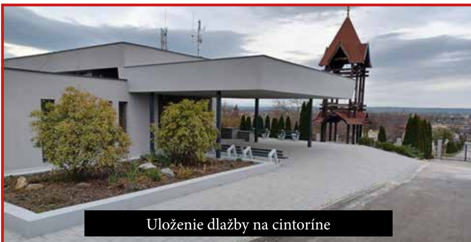
Uloženie dlažby na cintoríne