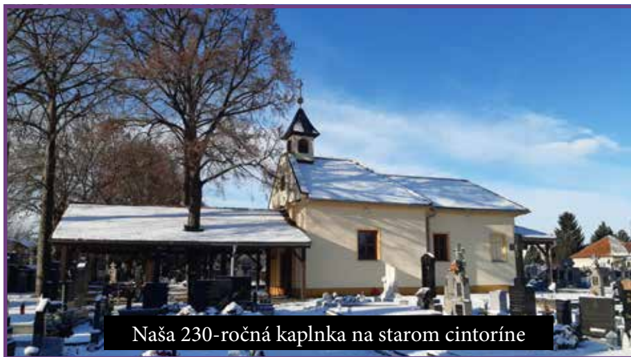
Naša 230-ročná kaplnka na starom cintoríne

stala medený povrch s novým krížom. Budova kaplnky bola rozšírená o sakristiu, chladiacu miestnosť a prístrešok, na ktorý sa opäť vrátil nápis „Feltámdunk!“. Vľavo od kaplnky je 225-ročný