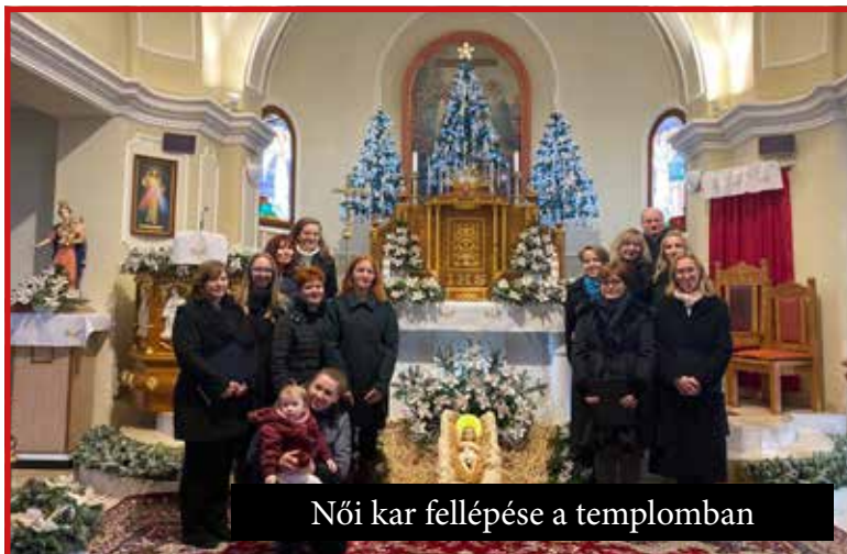
Női kar fellépése a templomban