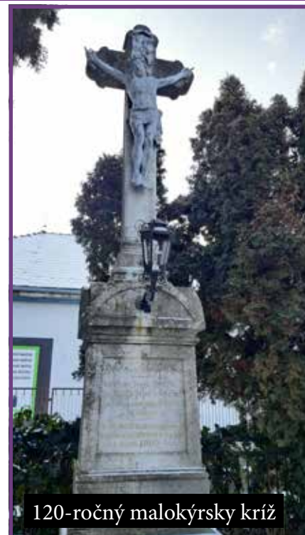
120-ročný malokýrsky kríž

Väčšinu krížov postavených v rokoch 1850 – 1930 postavili veriaci našej obce na vlastné náklady. Výročie postavenia