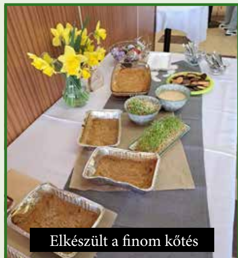
Elkészült a finom kötés

közös májusfaállításon találkozhatunk, ahol a Veselá muzika zenekar és DJ Xelo fogja szórakoztatni az érdeklődőket. Júniusban kerül megrendezésre a helyi Csemadok szervezésében a hagyományos Csemadoknap, júliusban pedig a Cserdavin által szervezett Nyitott pincék napja, amely évről - évre több borkedvelőt vonz a szőlőhegyre. A 2023-as évben sem maradhat el a falunap, amelyet idén július 28. – 30 szervezünk. További részletekért figyeljék Nagyker Község honlapját, facebook oldalát és a hangosbemondót.