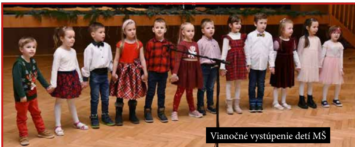
Vianočné vystúpenie detí MŠ

Pozvanie na rodinnú batôžkovú zábavu do veľkého kultúrneho domu prijali desiatky rodín, a tak sa so starým rokom lúčili za spoločného tanca bratanci a sesternice, susedia i kolegyně; nezáležalo na veku, každý sa tešil na tombolu a polnočný ohňostroj. Pamätne bude, že bolo nezvyčajne teplo tak v noci, ako aj na nový rok. V prvom vysielaní obecnej TV sa obyvateľom prihovorila pani starostka, ktorá mimochodom takisto vyzdvihla aktívnu činnosť obyvateľov obce pôsobiacich v rôznych športových a kultúrno-spoločenských organizáciách. Traja králi roznašali