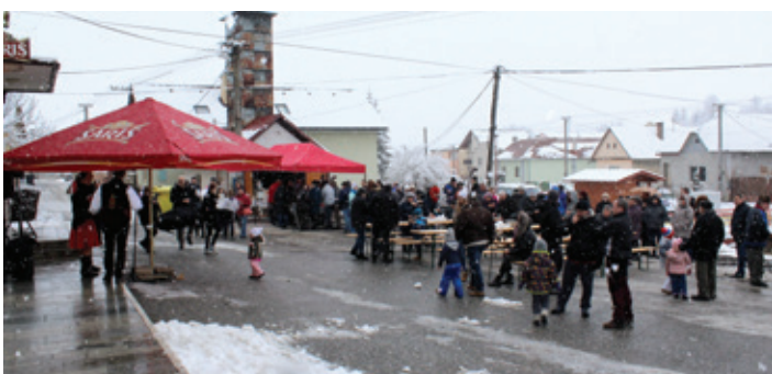
Fašiangové chuťovky 2018