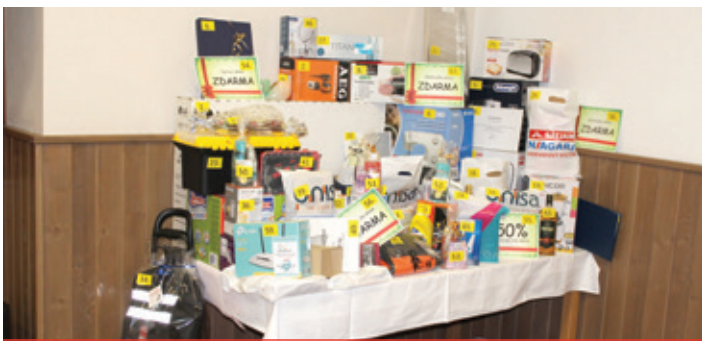
Obecný ples 2018 - tombola