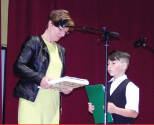
Deň matiek 2018 - osobné ocenenie žiaka riaditeľkou ZŠ s MŠ