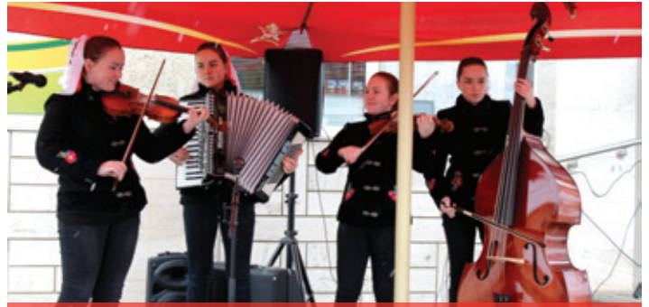
Fašiangové chuťovky 2018 - JAS