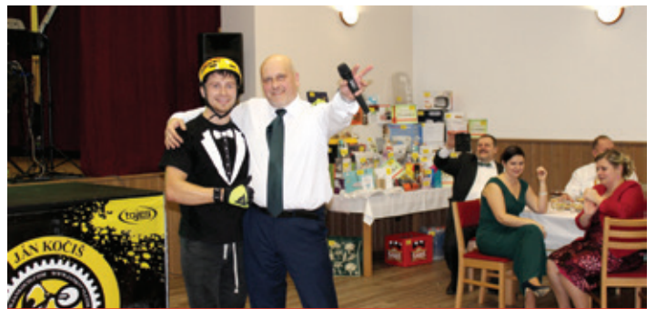
Obecný ples 2018 - záver programu