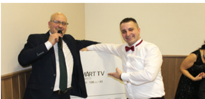
Obecný ples 2018 - víťaz hlavnej ceny