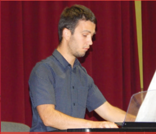
Deň matiek 2018 - vystúpenie ZUŠ Spišské Podhradie