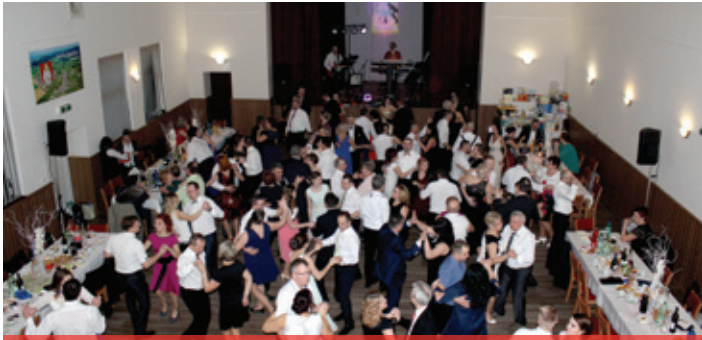
Obecný ples 2018 - všetci tancujeme