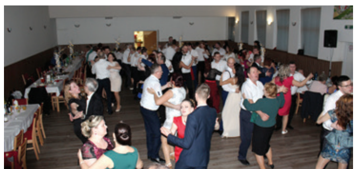
Obecný ples 2018 - zábava vrcholí