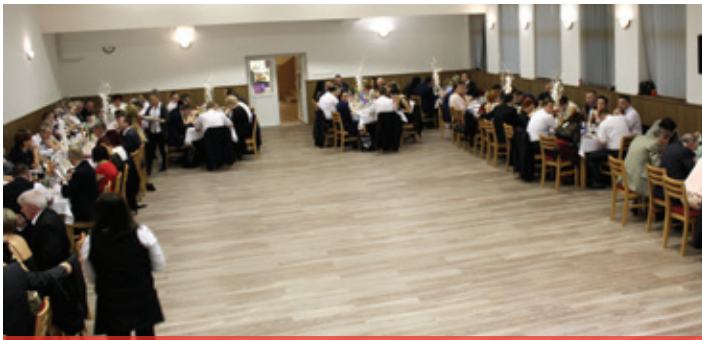
Obecný ples 2018 - začíname