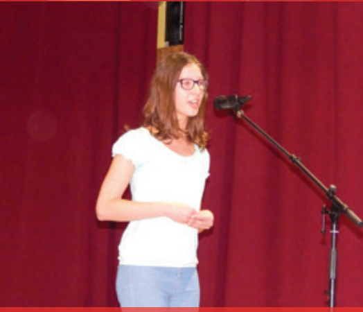
Deň matiek 2018 - vystúpenie ZUŠ Spišské Podhradie