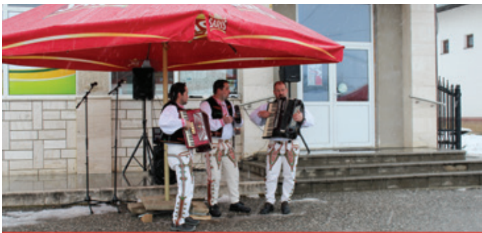
Fašiangové chuťovky 2018 - Kurilovci