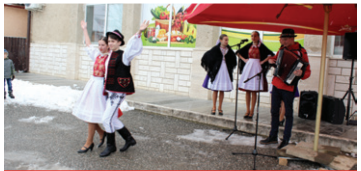
Fašiangové chuťovky 2018 - ZUŠ