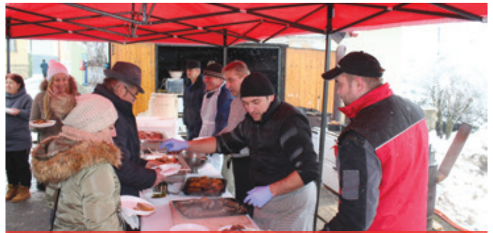
Fašiangové chuťovky 2018 - Dobrú chuť!