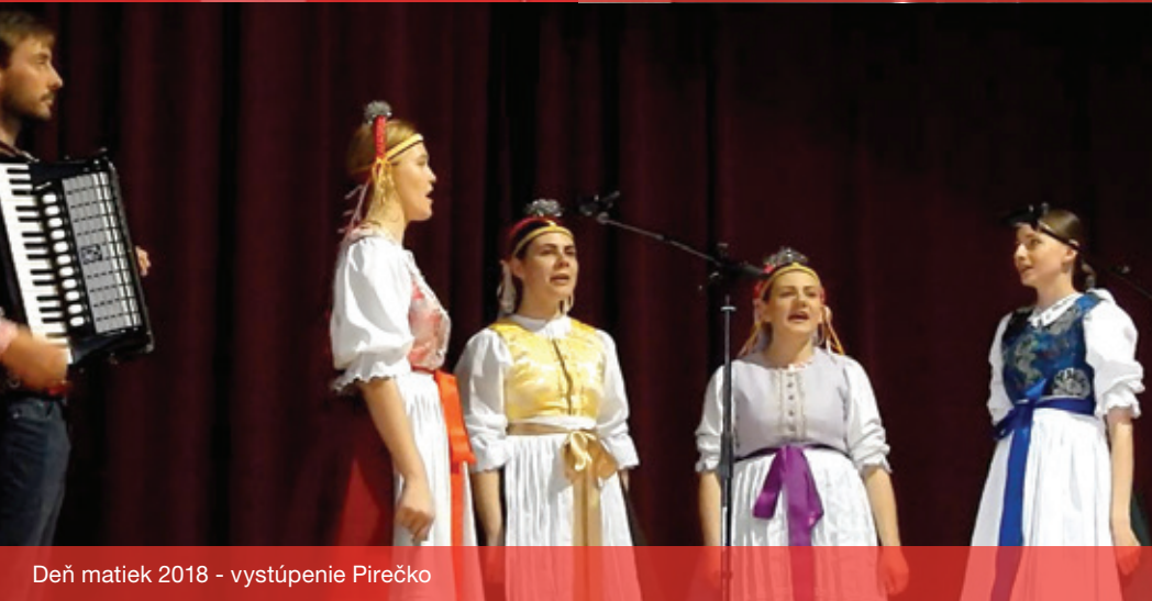
Deň matiek 2018 - vystúpenie Pirečko