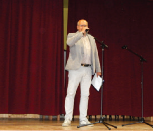
Deň matiek 2018 - uvítanie prítomných starostom