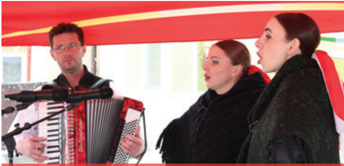
Fašiangové chuťovky 2018 - Jablonečka