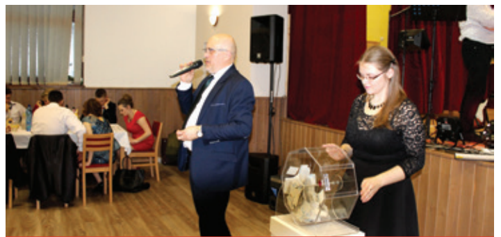
Obecný ples 2018 - začína tombola