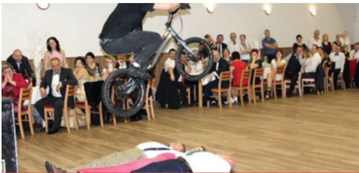
Obecný ples 2018 - majster sveta v cyklotriale