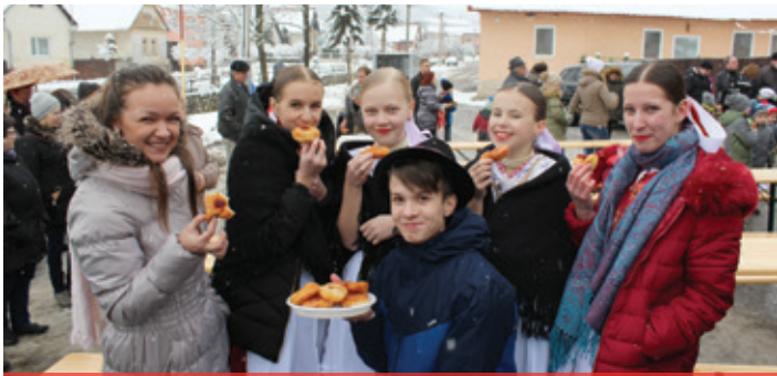
Fašiangové chuťovky 2018 - aj pankušky