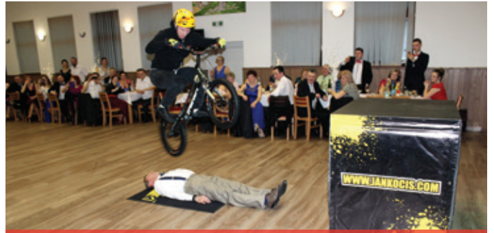
Obecný ples 2018 - program