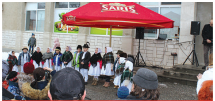
Fašiangové chuťovky 2018 - Materská škola