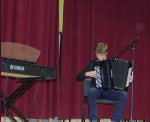
Deň matiek 2018 - vystúpenie ZUŠ Spišské Podhradie