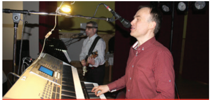
Obecný ples 2018 - Sonáta hrá do tanca