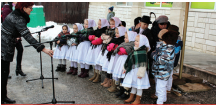
Fašiangové chuťovky 2018 - Materská škola