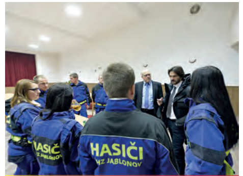
Posedenie a debata s ministrom vnútra SR