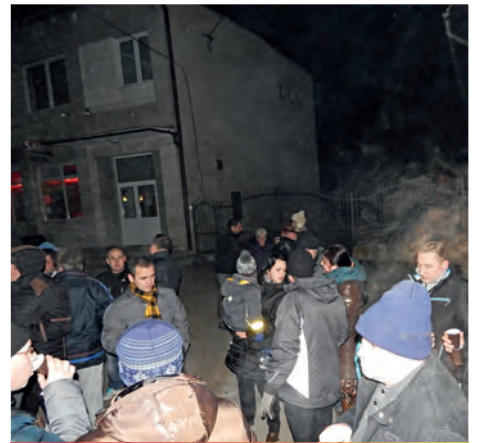
Silvestrovský punč 2015