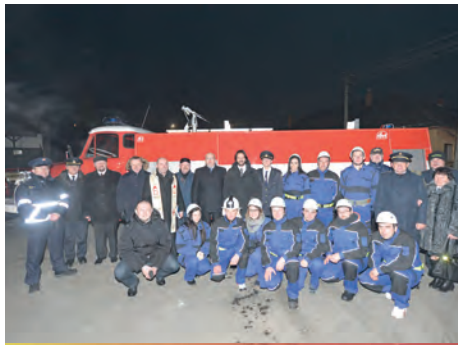
Odvzdávanie repasovaného hasičského vozidla ministrom vnútra SR R. Kaliňákom