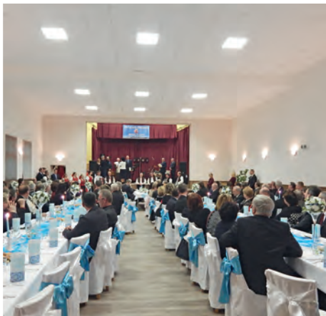
Prezident - ZMOS