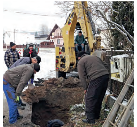
Porucha na obecnom vodovode