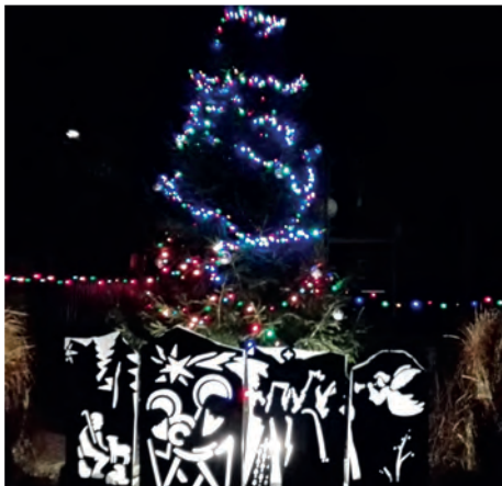
Jablonovský betlehem v noci