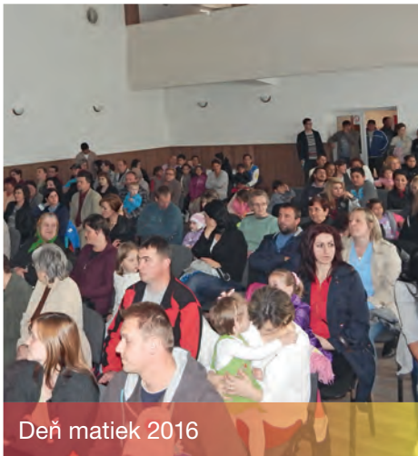
Deň matiek 2016