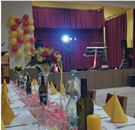
Obecný ples 2016