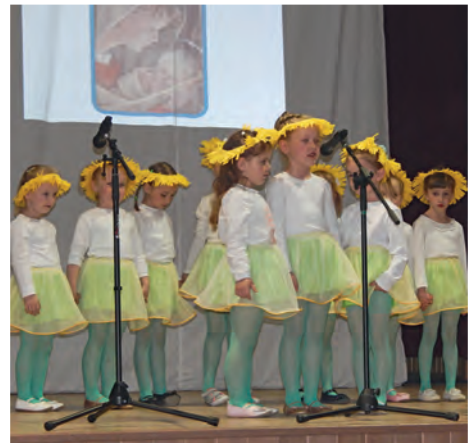
Deň matiek 2016