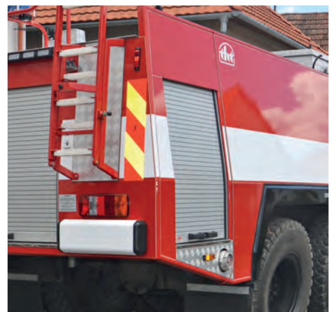
Barborka po repase