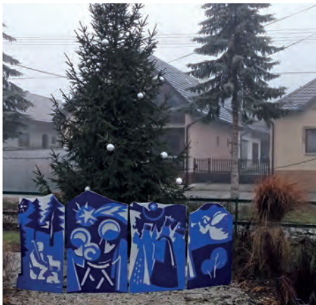
Jablonovský betlehem cez deň