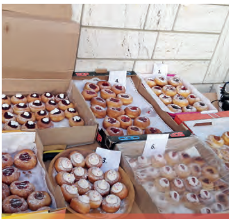
Súťaž o Zlatú Jablonovskú pankušku 2015