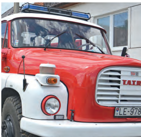
Barborka po repase