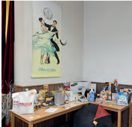
Obecný ples 2016