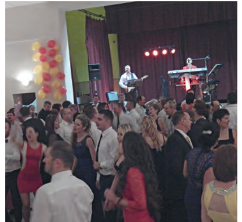
Obecný ples 2016