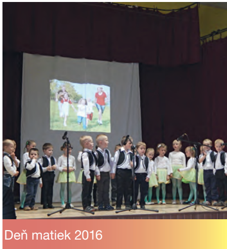
Deň matiek 2016