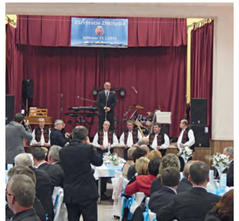
Prezident - ZMOS