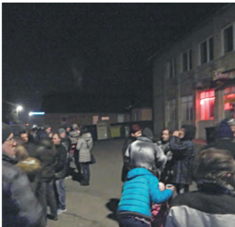
Silvestrovský punč 2015