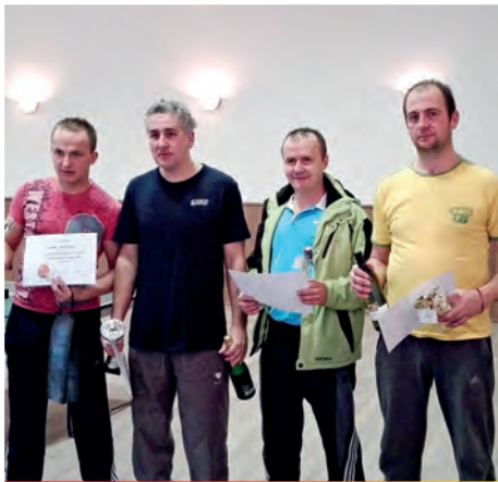
Silvestrovský stolnotenisový turnaj 2015 - víťazi