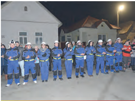
Odvzdávanie repasovaného hasičského vozidla ministrom vnútra SR R. Kaliňákom