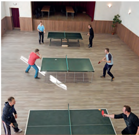
Silvestrovský stolnotenisový turnaj 2015