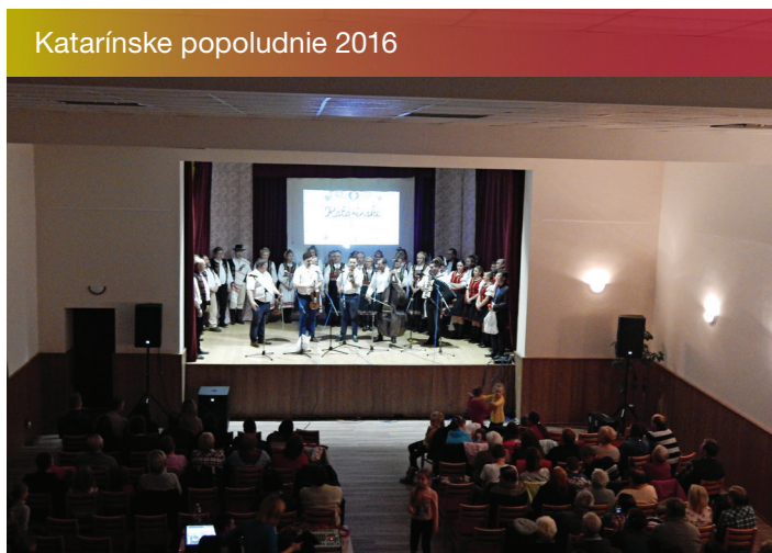
Katarínske popoludnie 2016