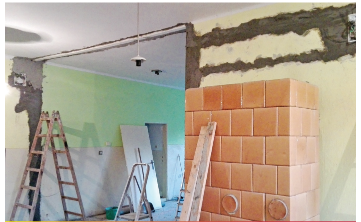
MŠ stavebné úpravy