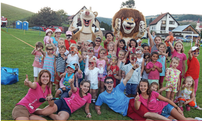
Jablonovské rodinné dni - deti a animátori