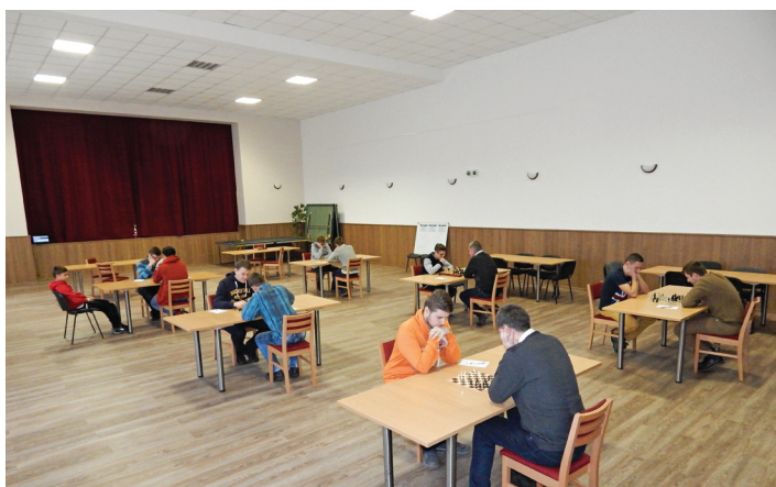
Mikulášsky šachový turnaj