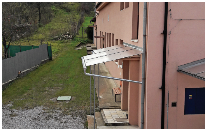
Strieška vchodu KD