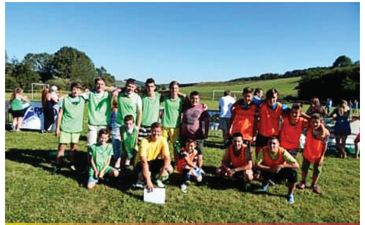
Jablonovské rodinné dni - Futbalový turnaj