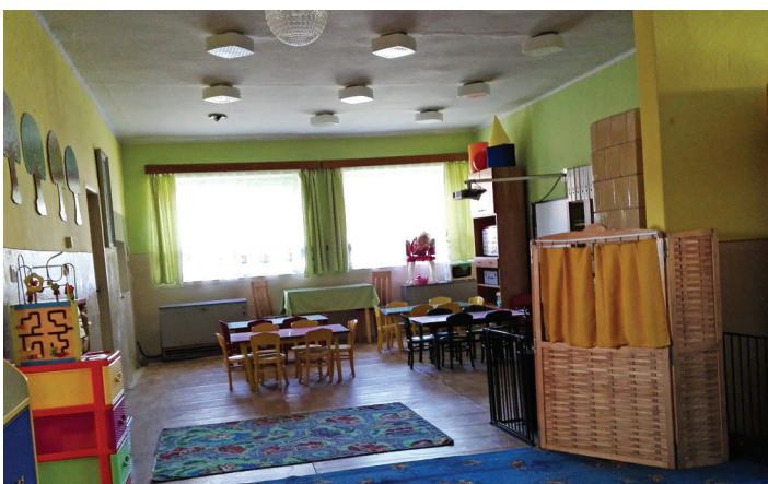
MŠ po stavebných úpravách