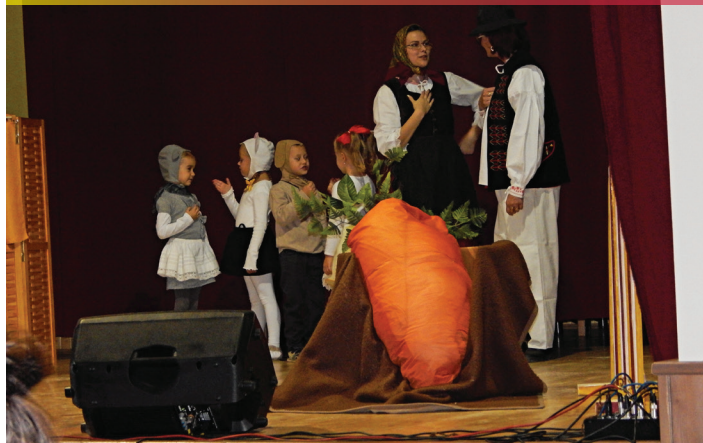
Mesiac úcty k starším