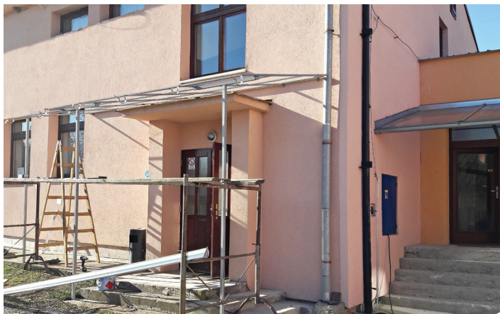
Montáž striešky vchodu KD