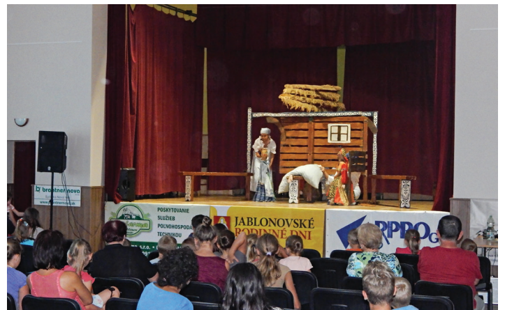
Jablonovské rodinné dni - Divadlo Babadlo z Prešova