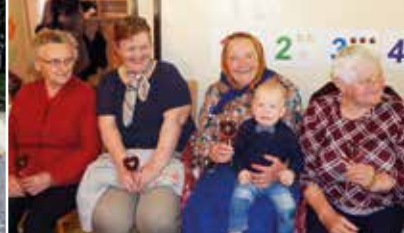
Deň matiek s prababkami