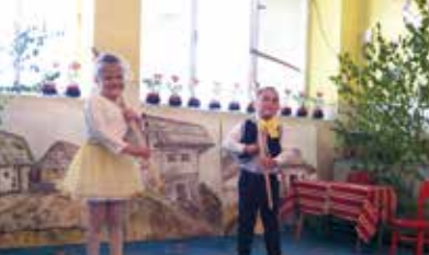
Deň matiek v MŠ