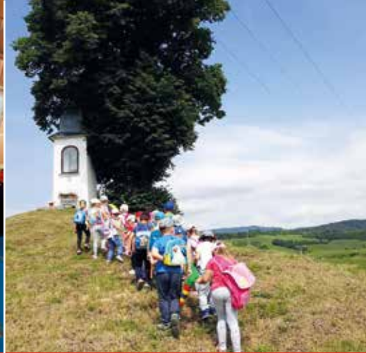
Potulky za pamiatkami obce