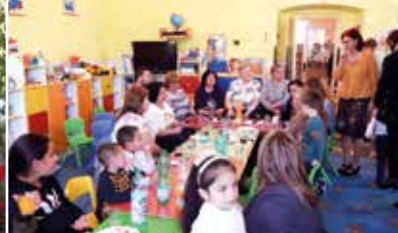
Deň matiek v MŠ