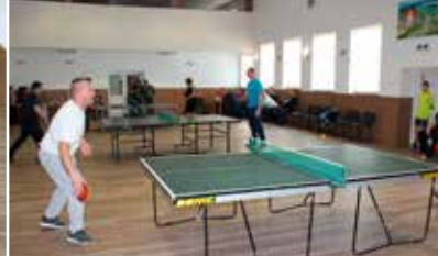
Silvestrovský turnaj 2019