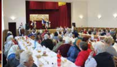
Úcta k starším