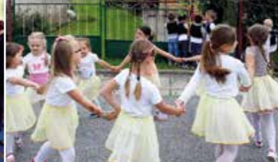
Stavanie mája v MŠ