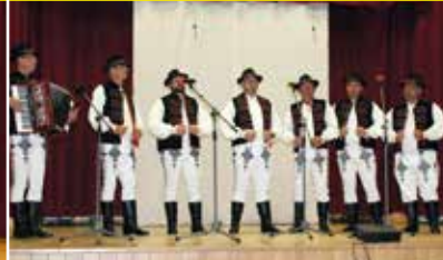
770. výročie Korčaskára