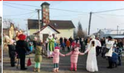
Popoludnie s Mikulášom