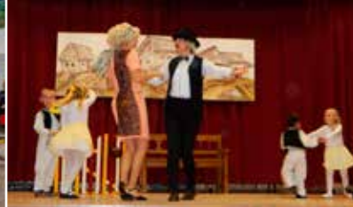
Úcta k starším