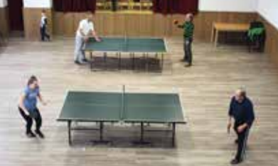
Silvestrovský turnaj 2019