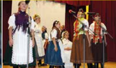
770. výročie Šafolka