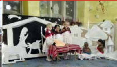
Vianoce v MŠ