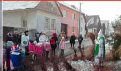
Mikuláš rozsvietil stromček