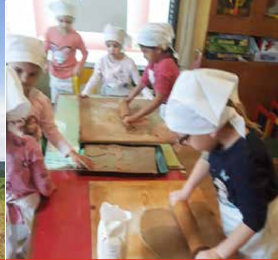
Vianočné medovníčky v MŠ