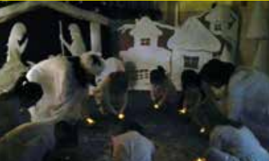
Vianoce v MŠ