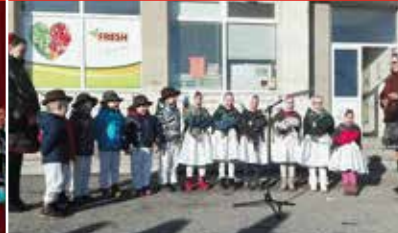
Fašiangová zabíjačka 2019