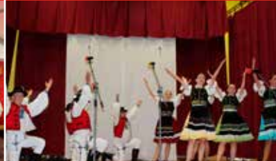
770. výročie Levočan