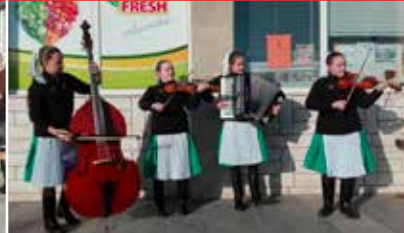
Fašiangová zabíjačka 2019