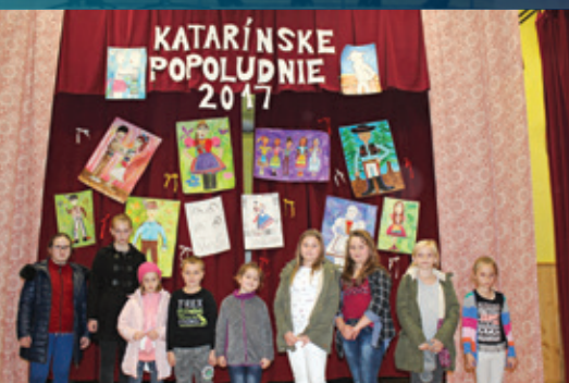
Katarínske popoludnie, výtvarníci