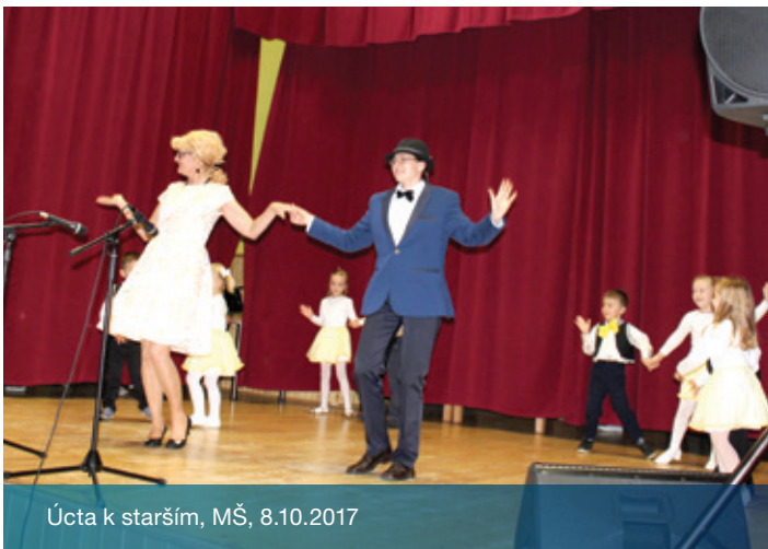
Úcta k starším, MŠ, 8.10.2017