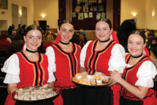
Katarínske popoludnie, uvítanie