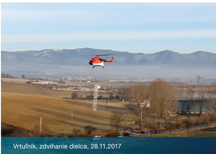
Vrtuľník, zdvíhanie dielca, 28.11.2017