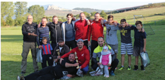
Futbalový turnaj, víťazi, 30.9.2017