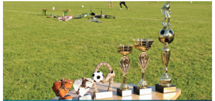
Futbalový turnaj - trofeje, 30.9.2017