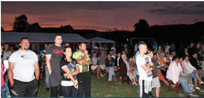
JRD, počas vystúpenia SČAMBY