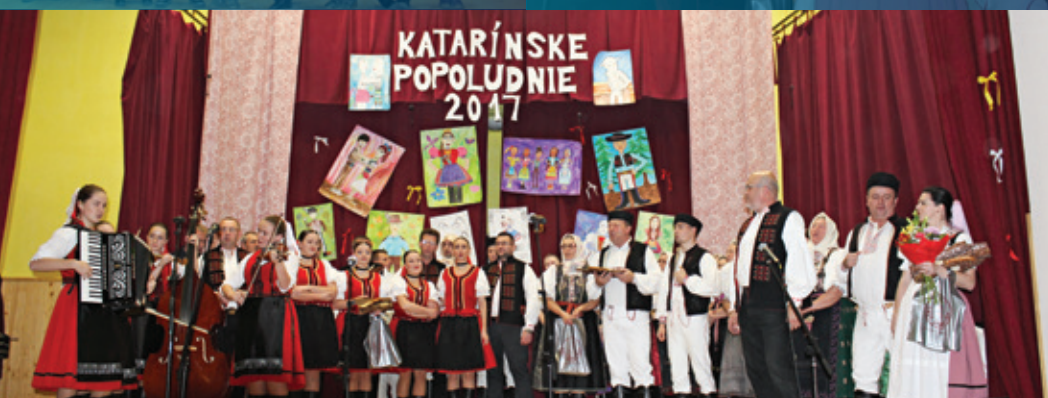
Katarínske popoludnie, záver

Stromček farebne blikoce, v kuchyni vonia škorica a med, nech srdce Vaše radosťou trepoce, z neba Boh zasiela živý dar na tento svet.