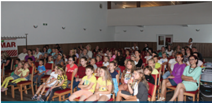
JRD, divadlo 25.8.2017