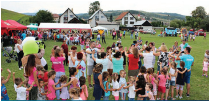
JRD, detská diskotéka s rodičmi, bufet