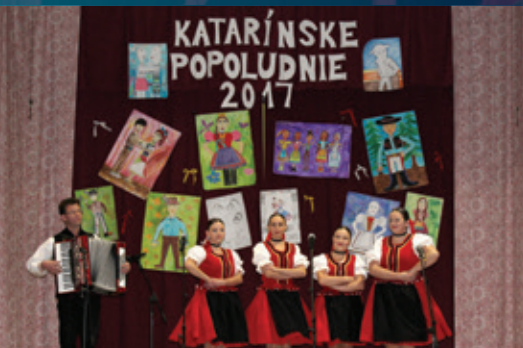
Katarínske popoludnie, ŽSS Jablonečka