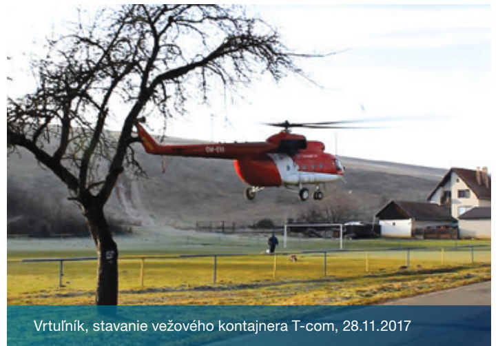
Vrtuľník, stavanie vežového kontajnera T-com, 28.11.2017