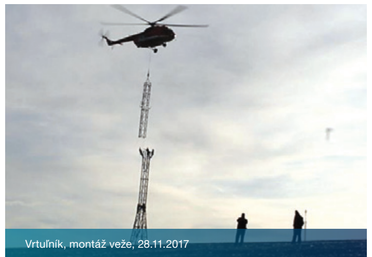
Vrtuľník, montáž veže, 28.11.2017