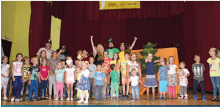
JRD, Včielka Maja nakoniec