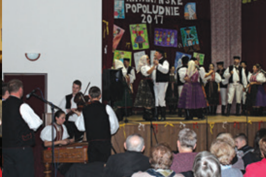
Katarínske popoludnie, Jadlovec Margecany