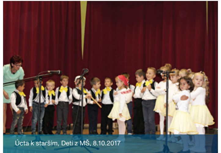
Úcta k starším, Deti z MŠ, 8.10.2017