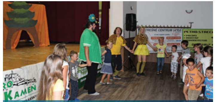
JRD, Včielka Maja