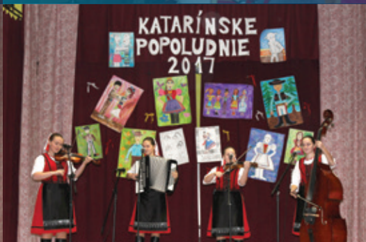
Katarínske popoludnie, LH JAS