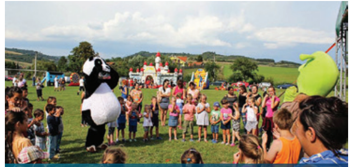
JRD, deti s animátormi a atrakcie 27.8.2017