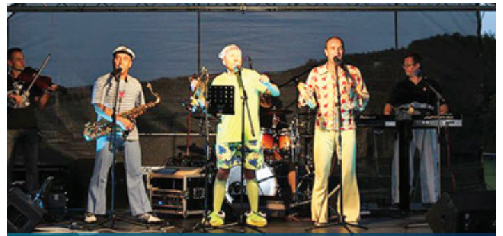
JRD, vystúpenie skupiny SČAMBA