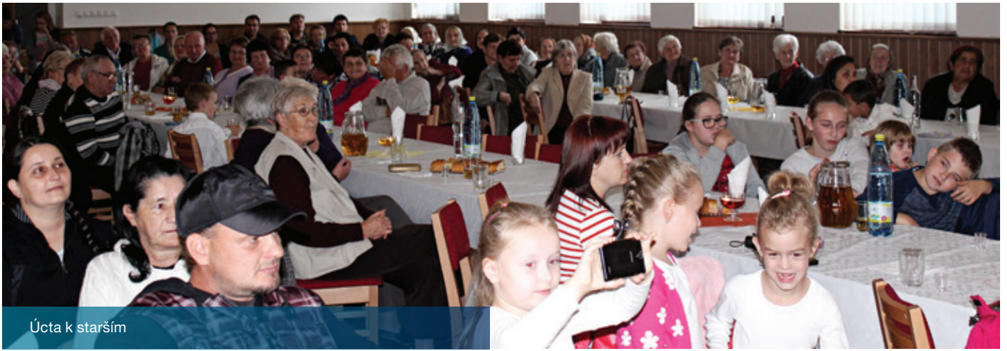
Úcta k starším