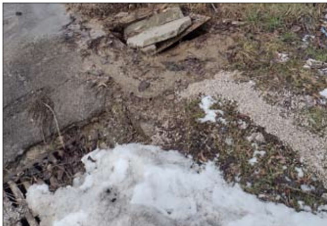
Parkováním sa ničia šachty, opravili sme ich. Uvidíme, ako dlho vydržia.