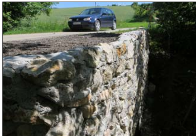
Most po oprave