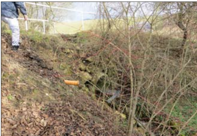
Most pred opravou