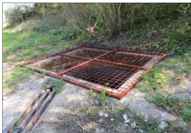
Záchyt vody po oprave