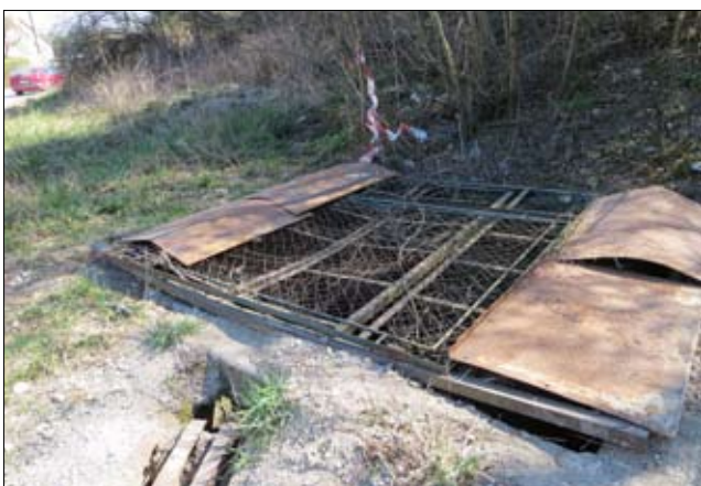
Záchyt dažďovej vody Dobrašov