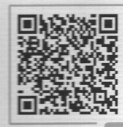
PAY by square

Vážený zákazník, dovoľujeme si Vám oznámiť, že z dôvodu zmeny fakturačného systému dochádza k nasledovným zmenám: