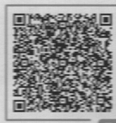
INVOICE by square