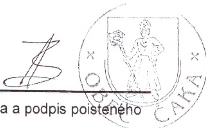
Pečiatka a podpis poisteného

Prvé poistné od 01.07.2014 do 30.09.2014 je vo výške : 0,94 Eur.