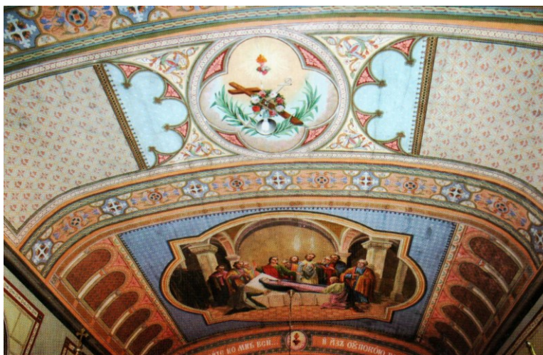
Obrázok č.2: Interiér kostola