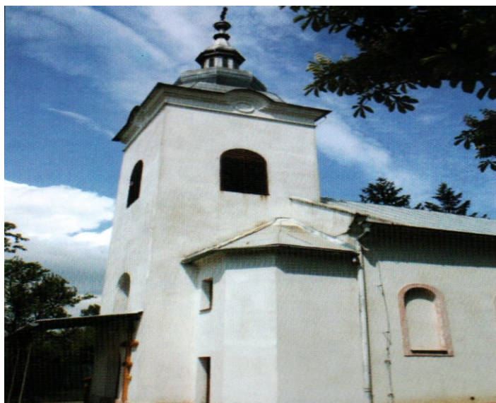
Obrázok č.1: Gréckokatolícky kostol