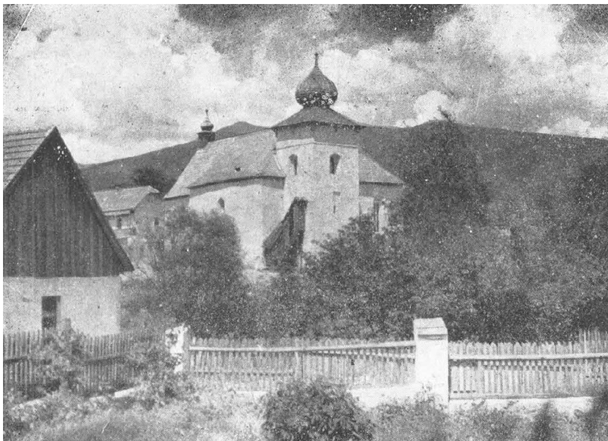
Kostol sv. Ondreja na fotografii zo začiatku 20. storočia