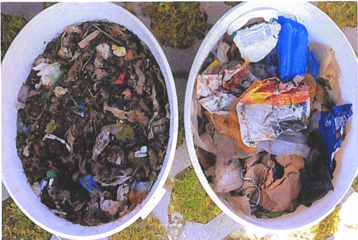
Výsledný produkt triedenia na nadsitnú a podsitnú frakciu

Ďalším významným faktorom, ktorý môže vplývať na cenu, sú podľa zväzu regionálne rozdiely. Napríklad ceny za skládkovanie môžu byť vyššie v oblastiach s nižším počtom skládok, alebo tam, kde je prístup k iným spôsobom nakladania s odpadom obmedzený.