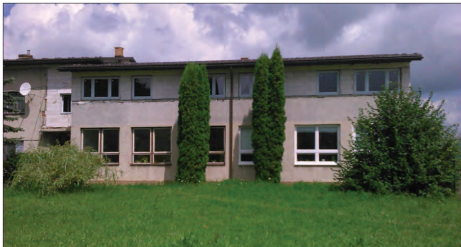
Budova základnej školy v Hervartove po doterajšej rekonštrukcii Primary school building in Hervartov after reconstruction Główny budynek szkoły w Hervartove po rekonstrukcji Здание основной школы в Хервартове после ремонта

Pri drevenom kostolíku bol vybudovaný objekt služieb cestovného ruchu financovaný zo združenej investície VÚC Prešov a obce Hervartov. V prevádzke je od októbra 2008. V jeho priestoroch sú dva apartmány so samostatným sociálnym zariadením, spoločenská miestnosť (vhodná na menšie rodinné oslavy), kaviareň, predaj suvenírov, informačné centrum a verejné toalety.