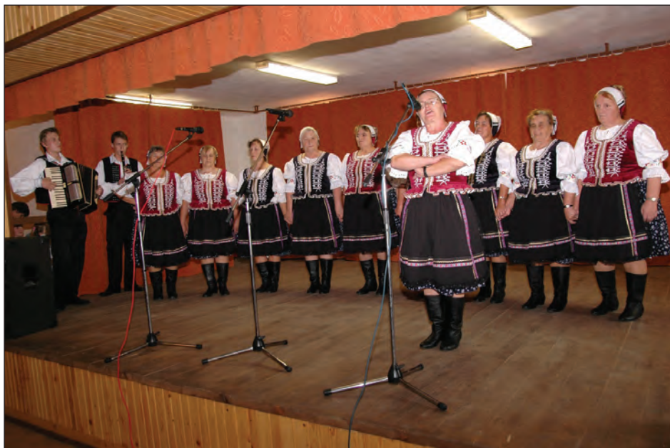
Hervartovské „Babičky“ “GRANDMOTHERS” from Hervartov Hervartovské „Babičky“ „Бабушки“ из Хервартова

age, collect all the pieces of the past that have been preserved to permanently disappear, because this would become emptier our past, present and future poorer questionable.”