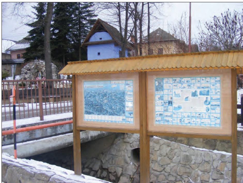
Pôvodná architektúra na obr. v pozadí, The original architecture in the background of the picture, Oryginalna architektura zdjecie, Архитектурные особенности

There are also produced hails mainly from barley by the peeler. In front of the peeler there was a „trajer“ – where the grain was cleaned from the darnel weeds (and it was adjusted to the next appropriate sowing)