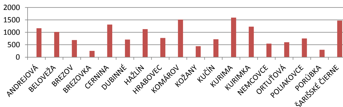
Graf Porovnanie obcí mikroregiónu podľa katastrálnej výmery