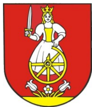
• Obecný erb