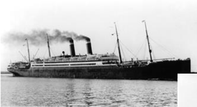
Parník „Amerika“ bol spustený na vodu v Belfaste v r. 1905. Viezol celkom 897 pasažierov, z toho 1. triedy 420, 2. triedy 254 a 3. triedy 223 pasažierov.

Vystáhalci cestovali do Ameriky na veľkých parníkoch, ktoré boli postavené koncom 19. a začiatkom 20. storočia. Boli konštruované na prevoz veľkého množstva chudobných vystáhalcov z Európy do USA.