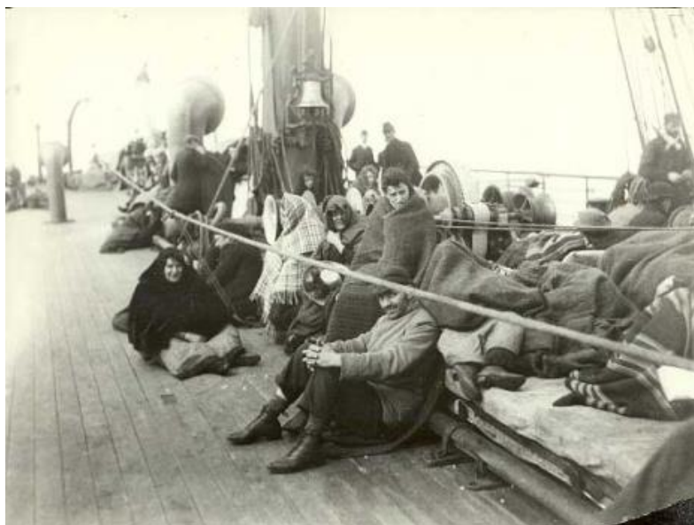
Vystáhalci na palube parníka. Rok 1892.

Cestujúci 3. triedy boli umiestnení v podpalubí, v malých izbách ležali ľudia na regáloch na jednoduchom slamníku, spolu muži, ženy aj deti. Strava bola minimálna, väčšinou sa museli stravovať zo svojich zásob. Pitná voda sa rozdávala na prídel v časových intervaloch, alebo len raz do dňa. Hygiena bola nedostatočná, vzduchu v izbe málo, mnohých premáhala morská nemoc.