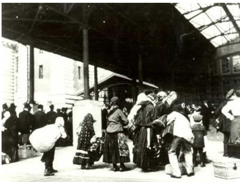
Čakanie pred vchodom do Imigračného úradu na lekársku prehliadku a vstupný pohovor s pristáhovaleckým úradníkom.

V rokoch 1820 – 1892 sídlil Imigračný úrad na juhu Manhattanu v prístave Castle Garden. Odtiaľ ho presťahovali na ostrov Ellis Island, kde v tieni Sochy Slobody postavili novú budovu a otvorený bol 1.1.1892. Tento ostrov sa premenil na malé mesto, v ktorom sa nachádzal nový Imigračný úrad, súd, škola, nemocnica, obchody a ubytovne. Večer 17. júna 1897 budova do základov vyhorela. Okamžite začali stavať novú budovu otvorenú 17. decembra 1900 a v tento deň prijali 2 251 pristáhovalcov. Cez tento ostrov prešlo medzi rokmi 1892 až 1924 do Ameriky viac ako dvanásť miliónov pristáhovalcov. V novembri 1954 bol Ellis Island oficiálne uzavretý. V r. 1965 vyhlásili Ellis Island za súčasť Národného pamätníka „Socha slobody“, ktorá bola postavená na susednom ostrove. Po dôkladnej rekonštrukcii otvorili ostrov pre verejnosť a v budove Imigračného úradu zriadili múzeum „Ellis Island Immigration Museum“. Múzeum navštevuje takmer 2 milióny záujemcov ročne.