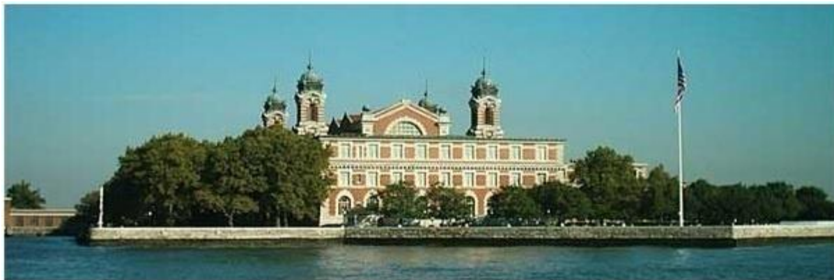
Budova Imigračného úradu dnes. V budove sídli múzeum pristáhovalectva „Ellis Island Immigration Museum“.

Po 10 až 60-tich dňoch pristála loď v prístave, pri móle East River v New Yorku. Vysťahovalci 3. triedy boli prevezení člmi alebo trajektami na ostrov Ellis Island, kde sídlil Imigračný /pristáhovalecký/ úrad a kde museli Kvačanci prekonať poslednú prekážku na ceste za lepším životom.